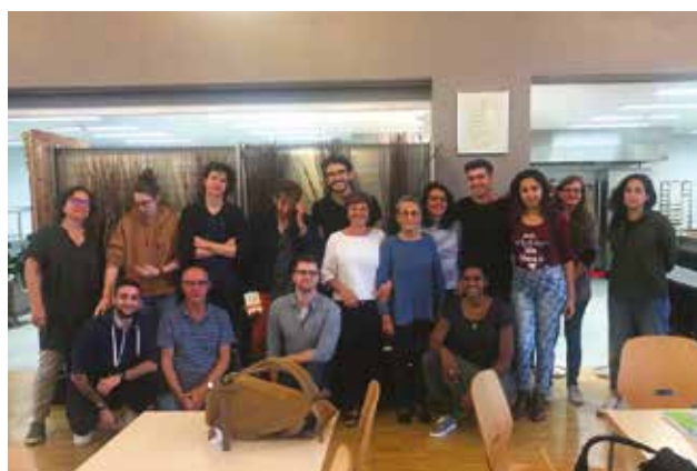
Une partie de notre équipe d'intervention à Aimée-Stitelmann