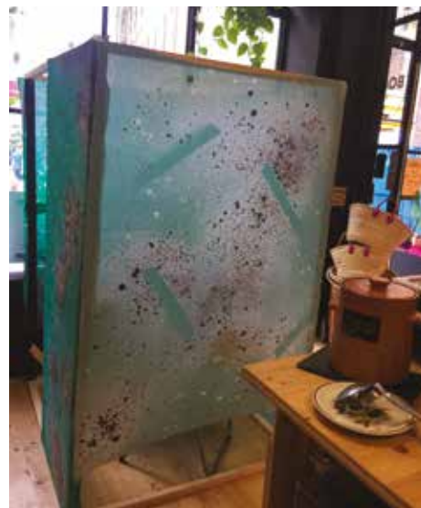
L'isoloir construit dans le Bocal Local