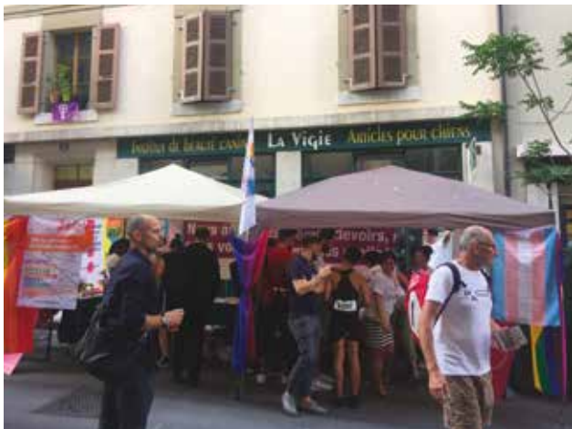
Le stand de la Fédération

en outre d'une animation commune entre Totem et le Refuge (voir le projet «Totem»), en participant au débat «Etre jeune LGBTIQ+ aujourd'hui» le 5 juillet sur la scène du village et bien sûr en défilant le 6 juillet dans les rues de Genève, avec un char animé par la musique de DJ-LAP. Les co-président.e.s de la Fédération ont également donné un discours lors de la soirée d'ouverture de la Pride à Pitoëff et, comme beaucoup d'associations LGBTIQ romandes ou nationales, la Fédération a contribué à la rédaction du manifeste politique de la Pride et l'a co-signé.