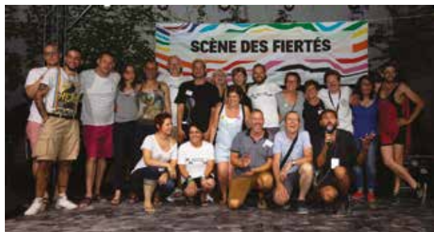
Les associations genevoises LGBT