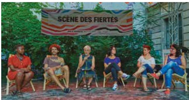
Les participant.e.s au débat « Etre jeune LGBTIQ+ aujourd'hui »