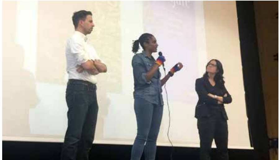
Au Collège de Candolle