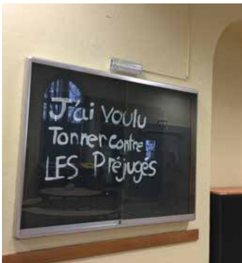
A l'ECG Ella-Maillart