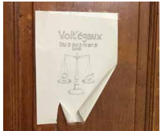
Au Collège Voltaire