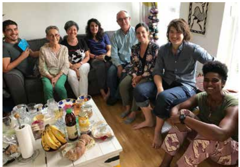
Une partie de l'équipe d'intervention