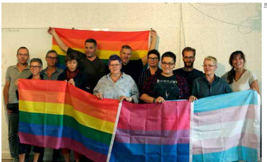
Création de la Fédération romande des associations LGBT

Le 1 er septembre, la Fédération romande des associations LGBT a été créée, regroupant 15 associations, dont la plupart des associations membres de la Fédération genevoise des associations LGBT. La création de la Fédération s'est faite dans la continuité des interassociations romandes, avec pour buts d'échanger, de construire ensemble et de porter une voix commune aux associations LGBT romandes.