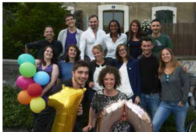
L'ancienne et actuelle équipe d'animation

Totem a été le tout premier projet de la Fédération, fondée en 2008. Vendredi 18 mai 2018, Totem a célébré ses 10 ans à l'Impact HUB de Genève. Date symbolique puisqu'elle se situait le lendemain du 17 mai, Journée Internationale contre l'homophobie, la lesbophobie, la biphobie et la transphobie.