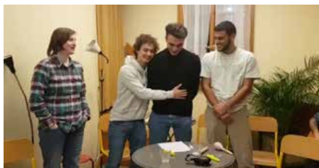
Elèves du Collège Voltaire

De nombreux élèves du secondaire II choisissent, chaque année, de travailler sur les problématiques que peuvent rencontrer les jeunes LGBT dans le cadre de leur Travail de Maturité ou un travail de groupe dans un cours «Citoyenneté» ou «Droits Humains». Ils/elles font ainsi régulièrement appel à Totem pour mieux connaître la réalité des jeunes LGBT et sollicitent les jeunes qui le