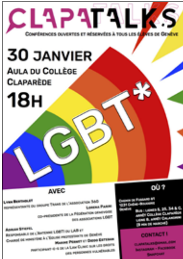
Au Collège Claparède

Nous remercions du fonds du cœur les enseignant.e.s, les élèves, les équipes MPS et le PAT des établissements scolaires qui ont mis en place des projets contre l'homophobie, la lesbophobie, la biphobie et la transphobie. Leur mobilisation, leur créativité et leur investissement ont permis de prévenir et lutter contre les violences et les discriminations et d'ouvrir le dialogue autour des questions LGBT.