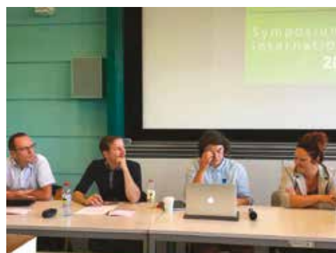
«La défense des droits des personnes LGBT et le travail en coalition»