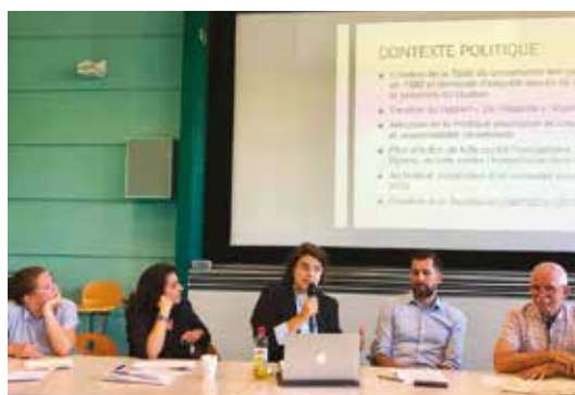
Table ronde «L'implantation de politiques publiques»