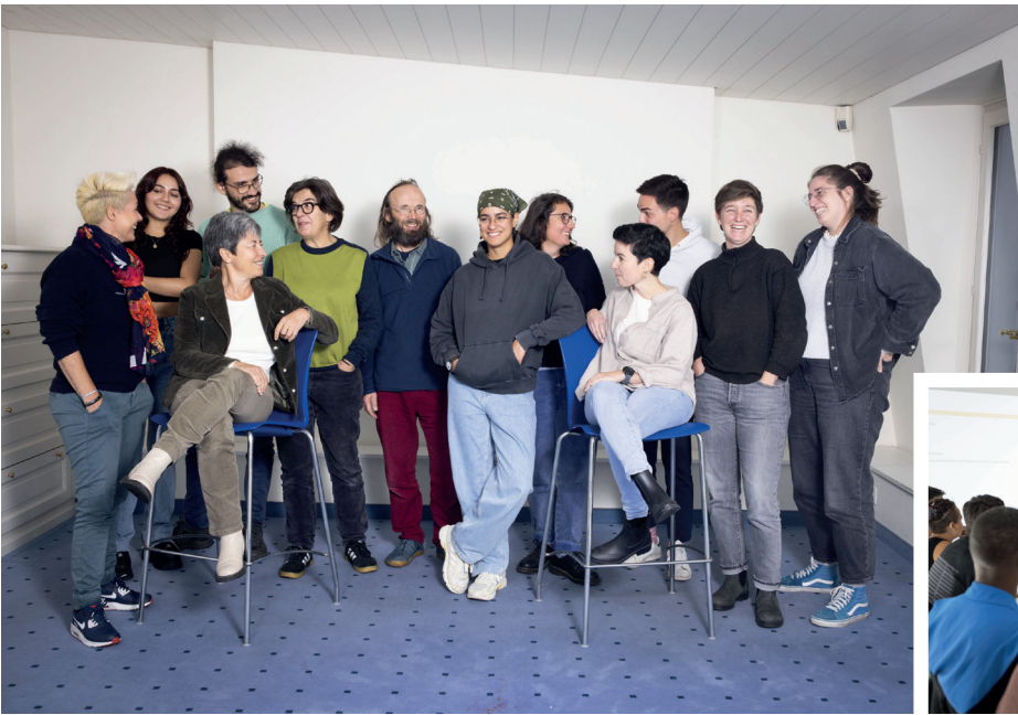
Une partie de notre équipe d'intervention en milieu scolaire