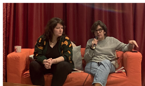
Discussion « Faire famille quand on est LGBTQ+ »