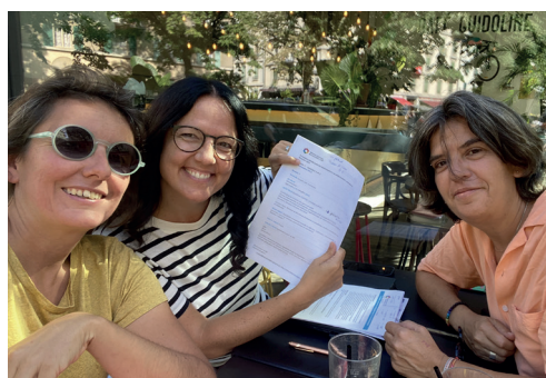
Le GT Education

Comment dire à nos parents qu'on est bi ou gay ?