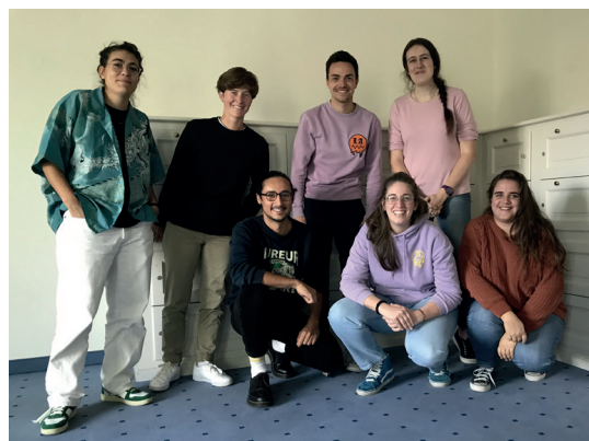
L'équipe d'animation en formation