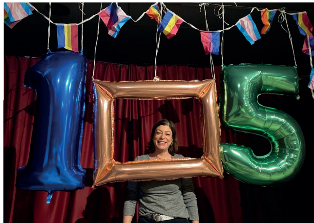
Célébrations des 15 ans