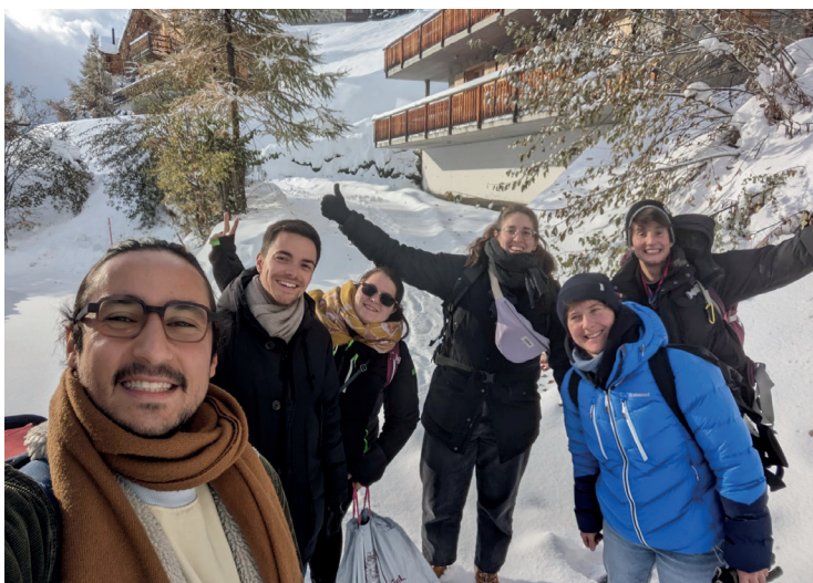
Week-end team building

Le comité de pilotage est composé actuellement de 5 personnes bénéficiant d'expériences en lien avec les questions LGBTQI+ et/ou la jeunesse, qui sont également d'anciennes animatrices qui souhaitent continuer à se consacrer au développement du projet. Ce comité de pilotage s'investit bénévolement et a pour mandat d'assurer le développement et le suivi du projet.