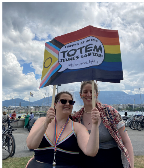
A la Pride